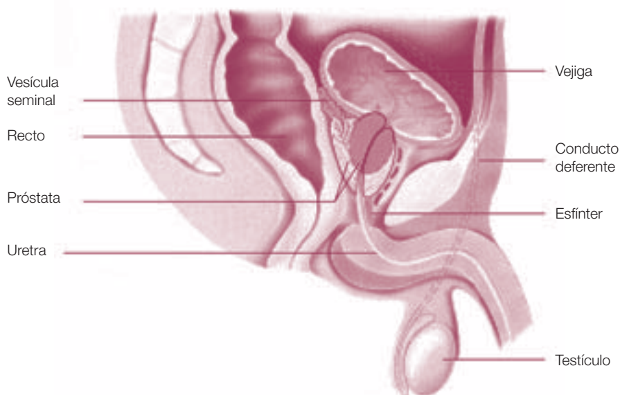
Figura 2. Aparato reproductor masculino (corte sagital-de perfil)

Alrededor de la uretra, un conjunto de fibras musculares reagrupadas bajo la próstata forman el esfínter urinario, el cual controla el paso de la orina mediante un proceso de contracción o de relajación, siendo así responsable de la continencia .